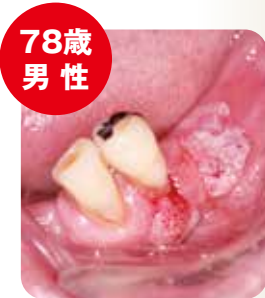
歯肉がん手術を受け、経過良好