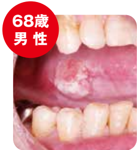
舌がん手術を受け、経過良好

*国立研究開発法人国立がん研究センター臨床進行度別5年相対生存率(口腔・咽頭 男女計 年診断例)より。 治療後5年間のがんの転移・再発がなければ治癒したとみなされます。